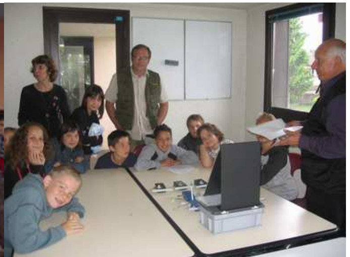
Théorie gonio au centre MJC

Tous mes remerciements aux organisateurs et au temps qui ne fut pas trop déluge.