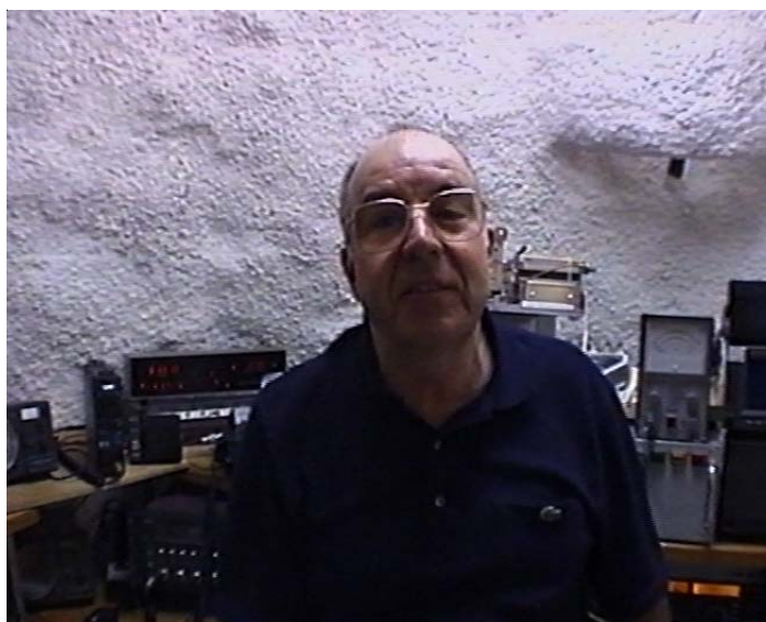
Image numérique DATV, enregistrée en VHS ! reçue par F5DB, avec une puissance d'émission de 0.5 mW !