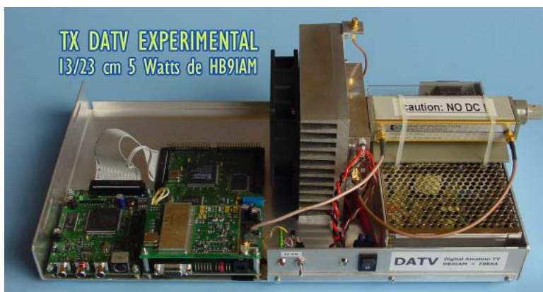
L'émetteur expérimental DATV utilisé pour cette liaison.

L'émetteur délivre une puissance maximum de 5 watts dans la bande de 23 centimètres et alimente par 20 mètre de coaxial, un groupement de 4 antennes Flexa 21 éléments.