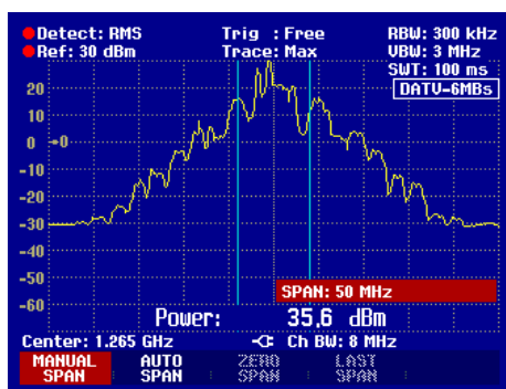
Spectre d'une émission ATV FM

La comparaison des spectres d'émission ATV FM et DATV, démontre que la modulation numérique offre l'avantage d'utiliser une largeur de bande fortement réduite.